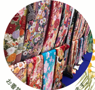
お着物多数ご用意しております

※当日ご契約の際には、 内金10,000円(現金のみ) を納めて頂きます。 詳細はスタッフまでお問い合わせください。